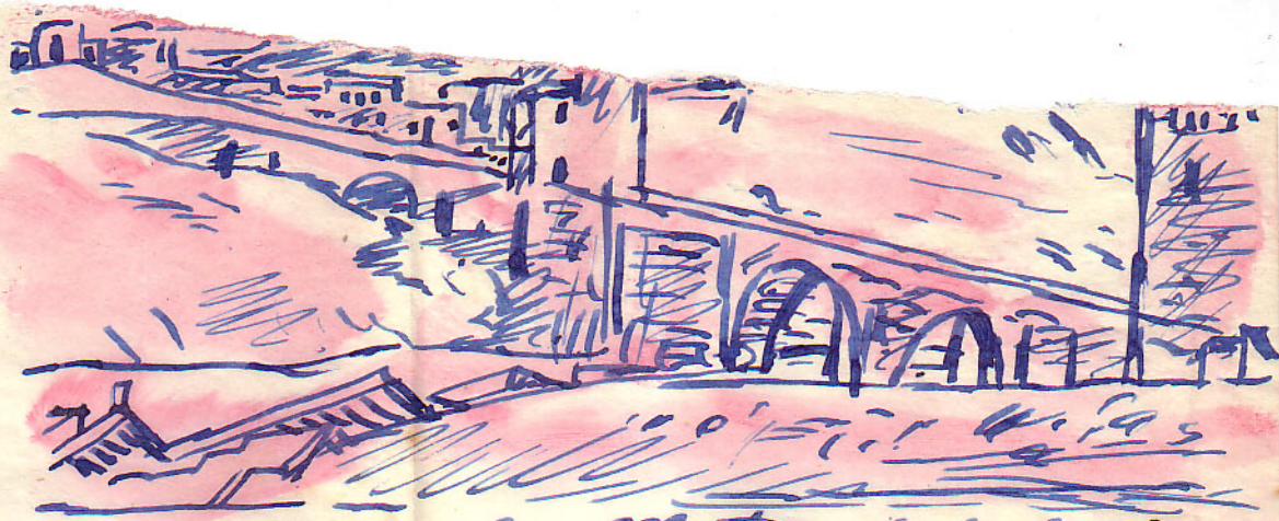
El Puente de San Martín desde los Cigales